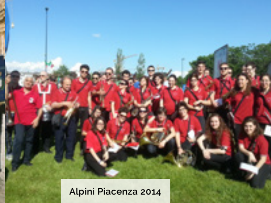
Alpini Piacenza 2014