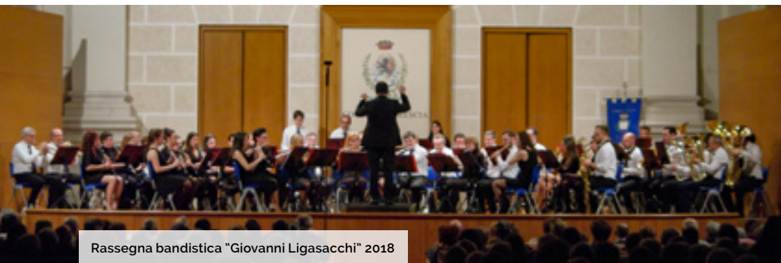
Rassegna bandistica "Giovanni Ligasacchi" 2018

Ad oggi la Banda Civica di Dello è composta da circa 50 elementi tra cui si contano anche diversi alunni diplomati e allievi che frequentano il conservatorio e vanta una lunga storia di servizi e eventi.