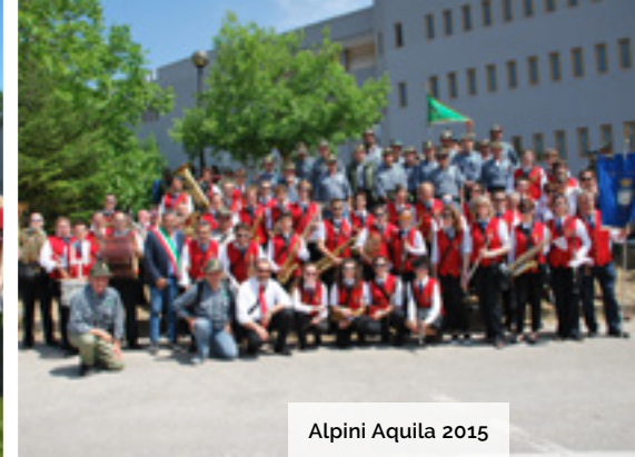
Alpini Aquila 2015

CD con altre Bande e Cori bresciani. Il 13 giugno '99 la Banda Civica è intervenuta al Concorso per Bande Giovani di Costa Volpino (BG) classificandosi al secondo posto; il 5 settembre dello stesso anno ha partecipato, per il secondo anno consecutivo, alla manifestazione d'Assisi con un concerto tenutosi nel piazzale della Basilica di S. Maria degli Angeli. Nel mese di maggio del 2000 la Banda ha inciso il suo primo CD in concerto; quattro mesi dopo si è esibita a Viserba di Rimini. Nell'ottobre 2001, avvenimento ancor vivo nella memoria dei bandisti, la Banda Civica di Dello si è recata a Roma e ha incontrato sua Santità Giovanni Paolo II in persona. Nello stesso anno la banda si esibisce in Piemonte a Venaria, in gemellaggio con la banda locale. L'11 maggio del 2003 la Banda Civica di Dello è ad Aosta in occasione dell'Adunata Nazionale degli Alpini.