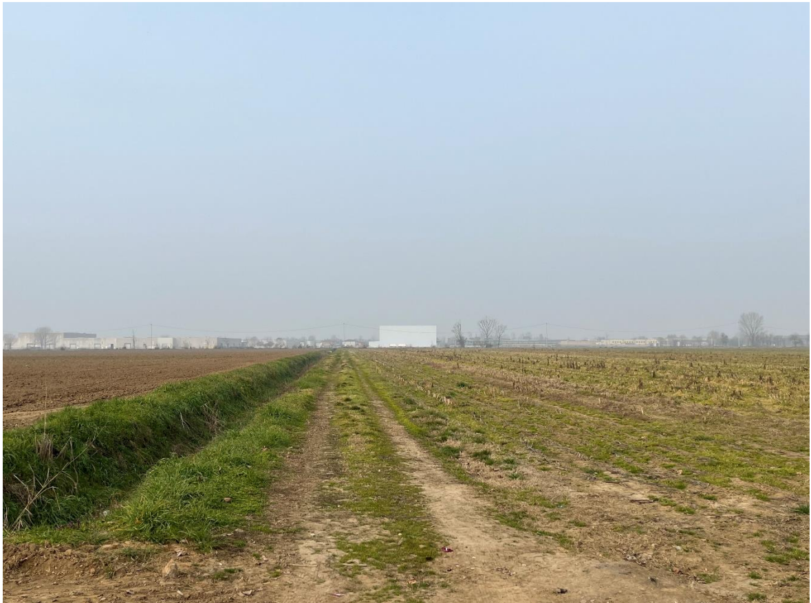
IMMAGINE 4 – STATO DI FATTO