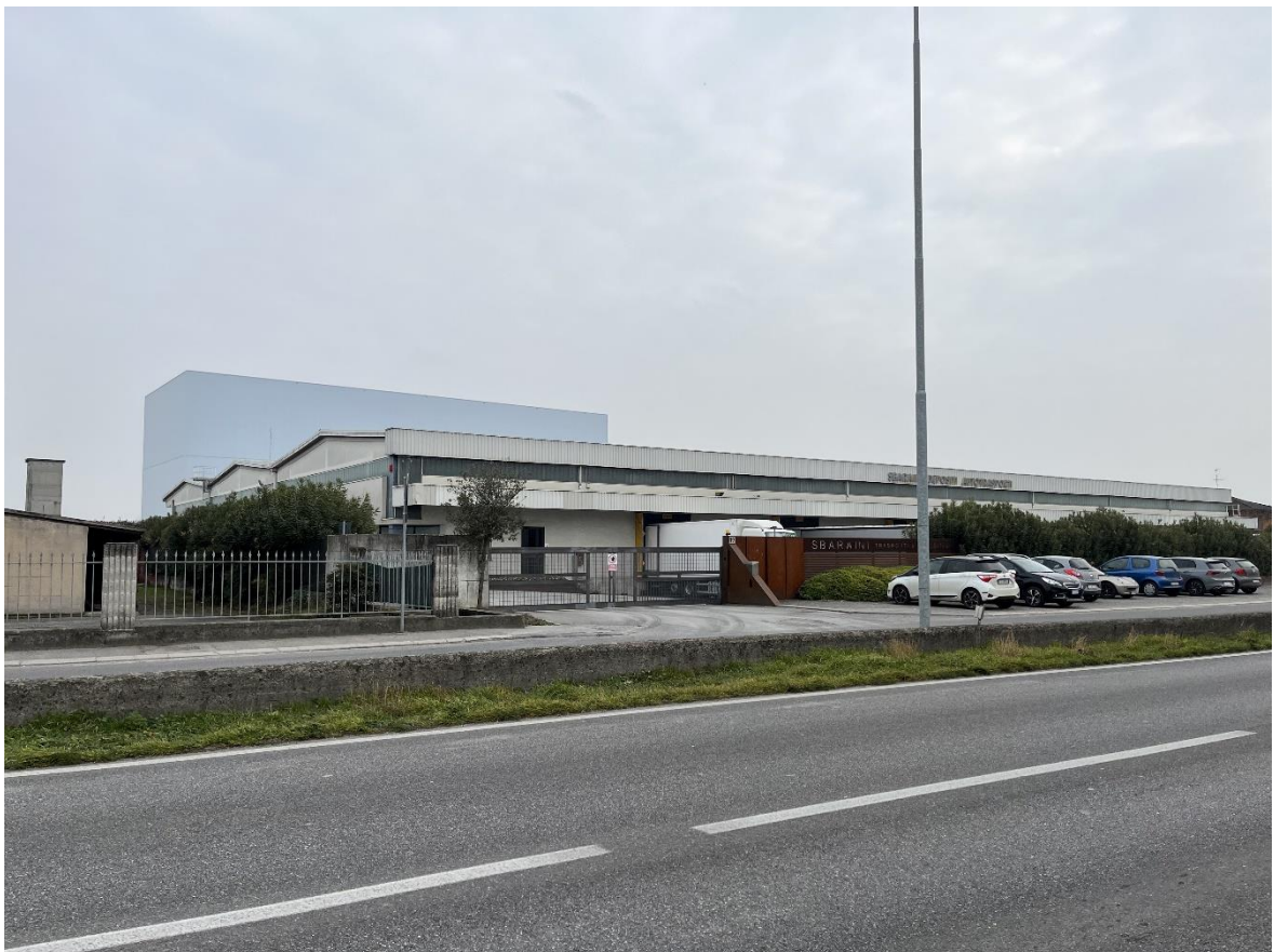
IMMAGINE 2 – STATO DI FATTO