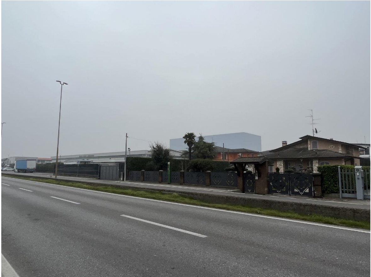
IMMAGINE 1 – STATO DI FATTO