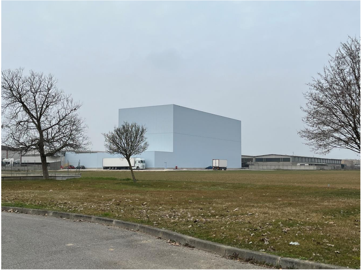
IMMAGINE 3 – STATO DI FATTO